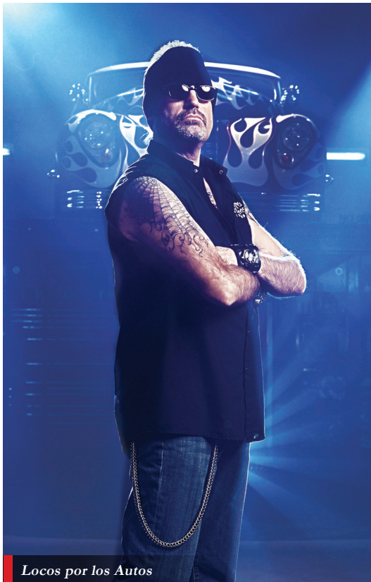
Locos por los Autos