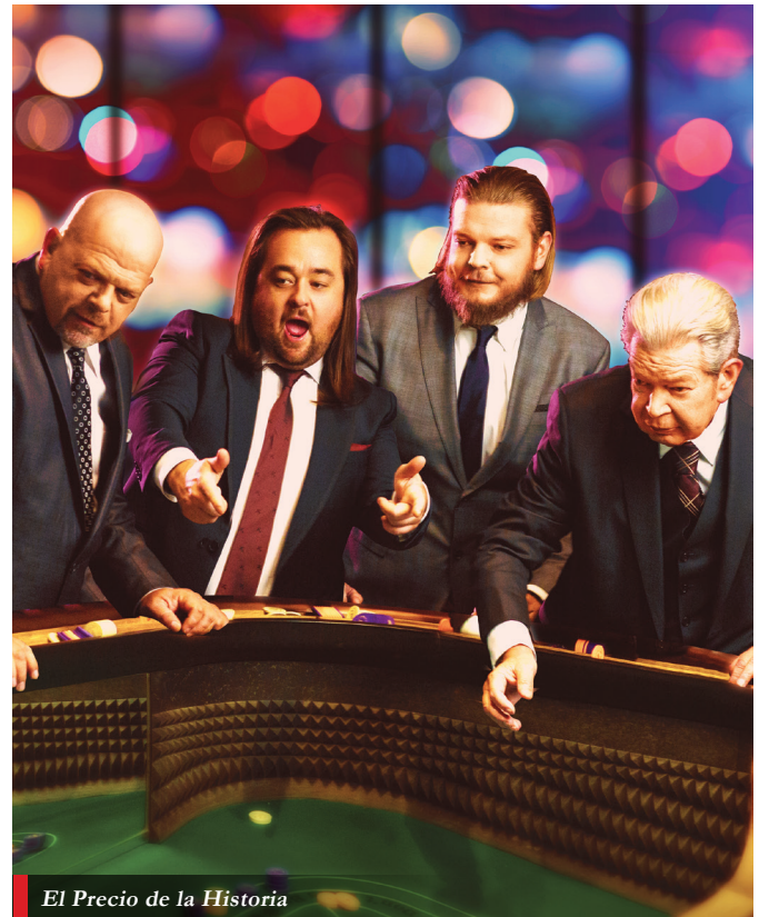
El Precio de la Historia