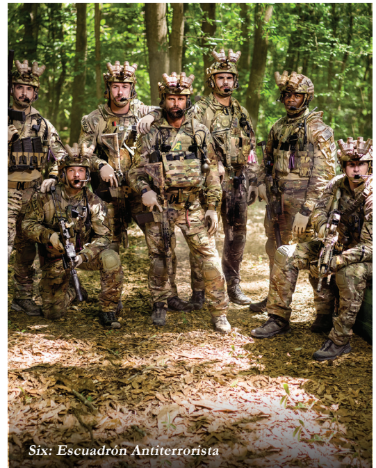
Six: Escuadrón Antiterrorista

un Emmy Internacional como Mejor Programa en Idioma Extranjero en Horario Estelar en el 2016.