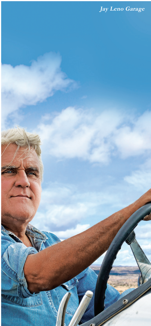
Jay Leno Garage