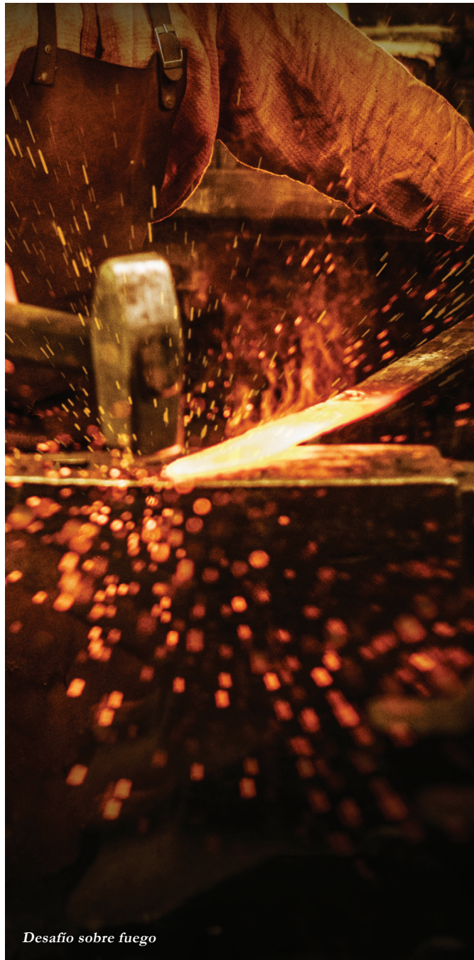
Desafío sobre fuego

HISTORY posee dos tipos de clientes; afiliados, como: Grupo Televisa, Telecom, IZZI, Sky, Megacable, Dish, Claro, entre otros, y anunciantes y agencias de publicidad, como: Nissan, Coca Cola, Procter &