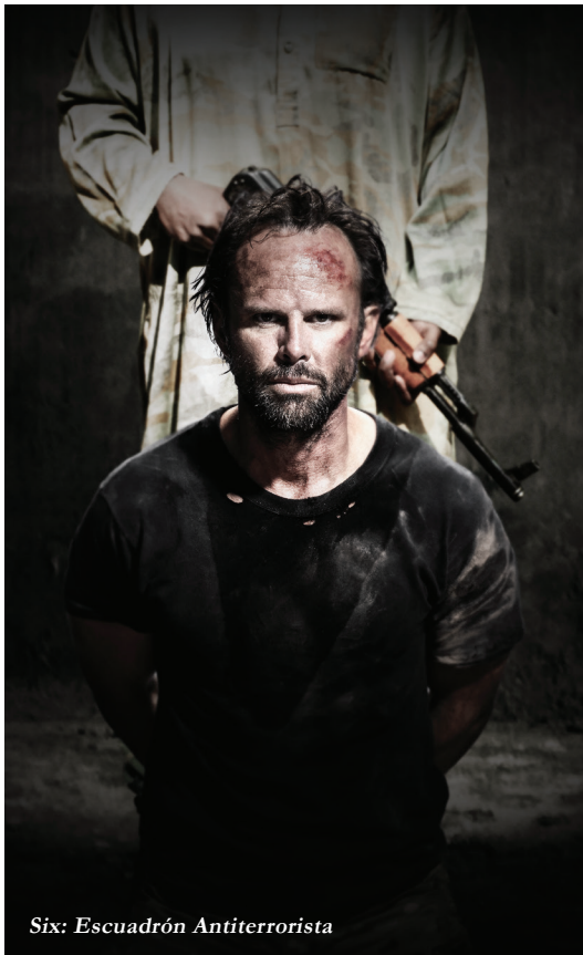
Six: Escuadrón Antiterrorista